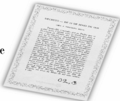
Réplica do Decreto de 13 de maio de 1808.

...a Imprensa Nacional foi criada através do Decreto de 13 de maio de 1808, assinado pelo Príncipe Regente D. João, com o nome de Impressão Régia e seu objetivo era o de imprimir, com exclusividade, todos os atos normativos e administrativos oficiais do governo?